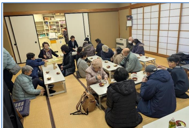
輪島市南志見地区

なお、お勤めに際し、東本願寺出版から無償提供された勤行本(和綴・小型)等をお渡ししております。上記の詳細やスタッフ不足等のお問合せやご相談がありましたら、ボランティア支援センターまでご連絡ください。