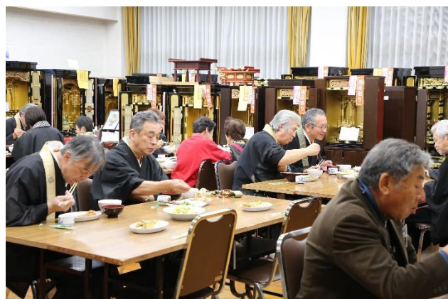
お斎会場 (11 月 12 日)

11月12日～13日、済美精舎(能登教務所)において「能登教区報恩講」が厳修されました。準備から当日の執行、後片付けまで教区内の御寺院、ご門徒の皆様、多くの方のご協力をおもちまして本年も無事に勤めることが出来ました。誠にありがとうございました。