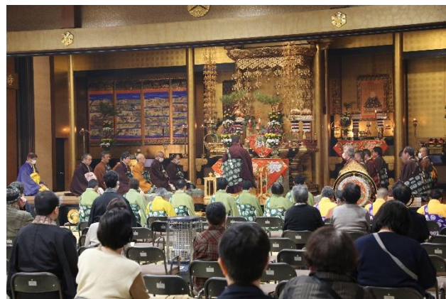
結願日中 (11 月 13 日)